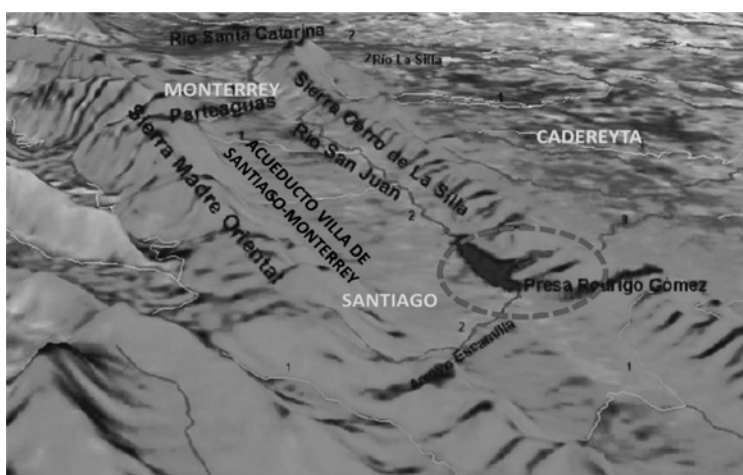
Figura 4. Presa «La Boca»