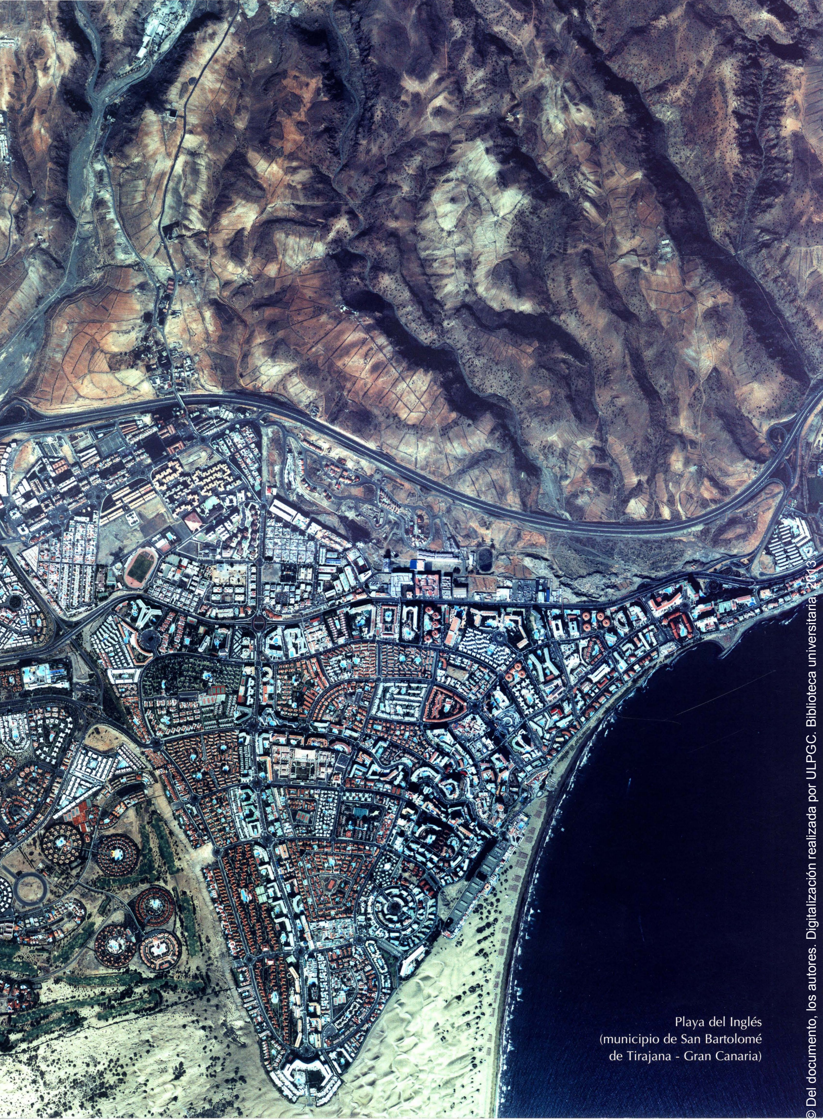
Playa del Inglés (municipio de San Bartolomé de Tirajana - Gran Canaria)