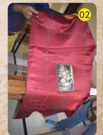
Estandarte de Santiago Matamoros