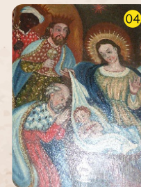
Adoración de los Reyes Magos