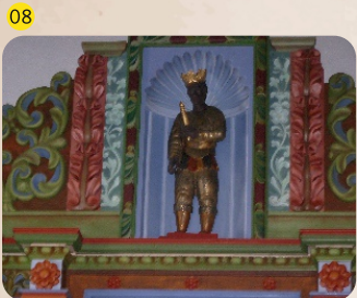
Baltasar, Nuestra Señora de los Reyes