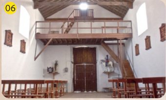
San Martín de Porres