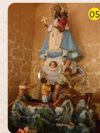
Nuestra Señora de la Virgen del Cobre