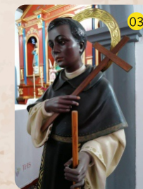
San Martín de Porres