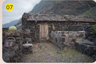
Caserío de Guinea