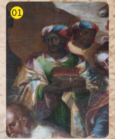
Adoración de los Reyes Magos