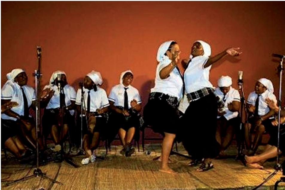
Lámina 1. Uma sessão do batuque