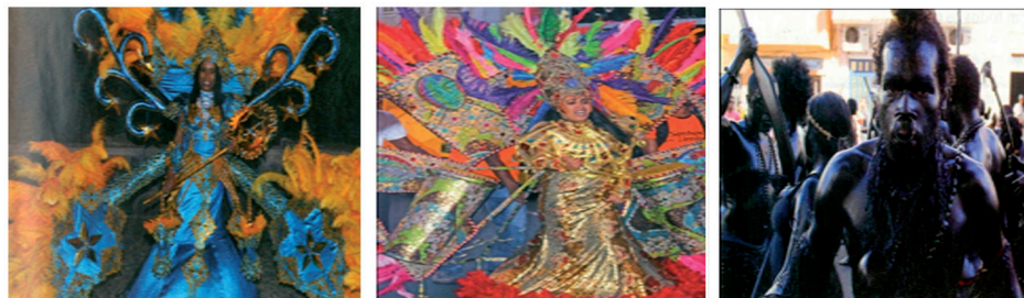
Lâmina 3. Desfile do carnaval na Cidade do Mindelo, São Vicente