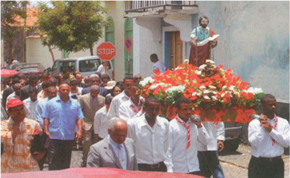
Lámina 4. Prossição religiosa no dia de S. João, Ilha de S. Vicente