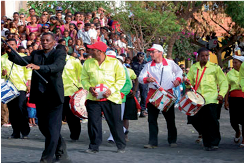
Lámina 2. Bandeira de São Filipe