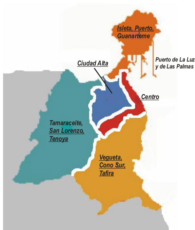
Figura 1. Localización del puerto y de los distritos del municipio de Las Palmas de Gran Canaria.

En la encuesta se tomaron algunas características socio-demográficas básicas que más abajo señalaremos, así como otros parámetros vinculados con las características que queríamos investigar y que no eran estrictamente sociodemográficas, como es el indagar sobre la percepción positiva y negativa de parámetros ambientales, económicos, socio-culturales, etc., todos imputables al turismo de cruceros. Como muestra de ello, destacamos los diferentes ítems siguiendo el orden de la encuesta: