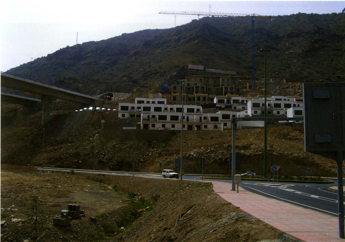
Urbanización in extremis. Puerto Rico. Gran Canaria.