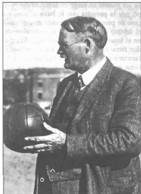
Figura 2. El Dr. James Naismith, inventor del baloncesto. (COLBECK, 1972: 23)

Los programas deportivos de invierno en USA eran extremadamente limitados y