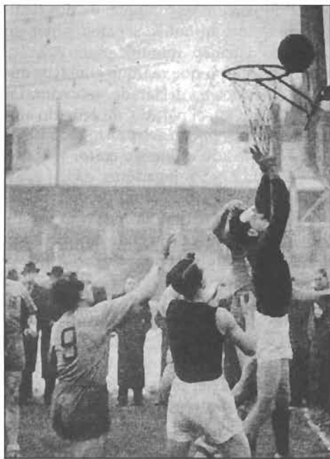
Figura 3. Encuentro jugado por soldados norteamericanos en Europa (1940). (RAYNAL, 1980: 82)

Alrededor de 1900, se jugaba el baloncesto en muchos lugares del país: Nashville, Brooklin, Chicago, Denver, Iowa, etc. Así, en el anuncio de la III Olimpiada, en Saint Louis (1904), los organizadores presentan una competición de baloncesto en la que participaron cinco equipos de Estados Unidos, como la "Olimpic World's Basketball Championship". Canadá fue uno de los primeros países donde se practicó el deporte de la canasta. Jóvenes representantes de la institución cristiana donde se gestó, como el mencionado Exner, llevaron igualmente el juego a Japón, Siria, Turquía, Alemania, Francia, América del Sur y Filipinas, donde fue incorporado por Elwood Brown en 1910. Alaska organizaría su primer campeonato en 1906. En cada lugar donde se instalaba, el baloncesto demostró ser un deporte popular. La única excepción a esta corriente fue Suráfrica, donde fue considerado demasiado afeminado para hombres pero jugado por las mujeres con entusiasmo (EDITORIAL, 1933: 36). El baloncesto llegó a Europa a través de las instituciones del YMCA repartidas por distintas ciudades. Pero el verdadero impulso se produjo con las fuerzas expedicionarias norteamericanas que participaron en la Iª Guerra Mundial, que en sus ratos libres lo practicaban con frecuencia.