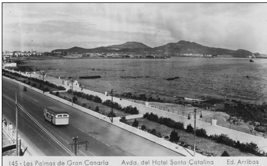
Foto 1. Al fondo se observa el conjunto de volcanes de La Isleta y delante el área del Istmo o falso tómbola de la ciudad de Las Palmas de Gran Canaria.

fía, morfología y clima, como por los usos económicos y sociales tradicionales que ha tenido– de la ciudad de Las Palmas de Gran Canaria. (Véase foto antigua del istmo y de La Isleta de la ciudad de Las Palmas antigua).