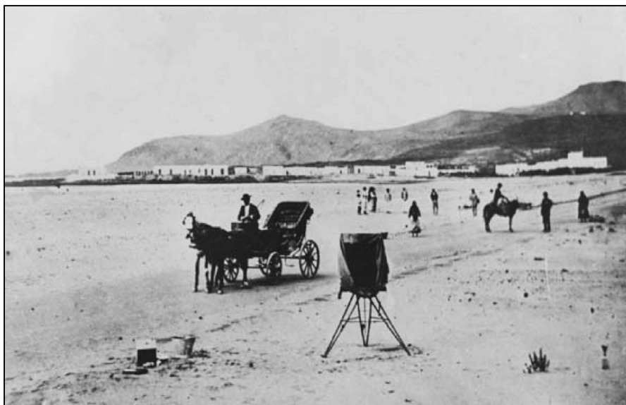
Foto 2. Istmo de Sta. Catalina. Las Palmas de Gran Canaria a principios del siglo XX. Dunas y plantas (halófilas y psanmófilas).

yas arenosas y dunas de tipo nebka —quilla de barco—. La vegetación de esta zona era fundamentalmente de plantas psanmófilas y halófilas (lechuga de mar, salados,...), es decir amantes de la arena y de la sal, productos del tipo de suelo y también de las características climáticas, que consisten básicamente en las de un clima desértico, es decir precipitaciones inferiores a los 125 mm. anuales y temperaturas suaves todo el año, gracias al papel atemperador del mar y a la corriente fría de Canarias. Esta es una breve descripción de las características físicas de esta zona. A continuación, vamos a proceder a señalar los principales hitos del uso humano.