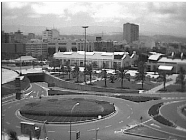
Foto 4. Vista de la trasera del parque Santa Catalina y comienzo del muelle del mismo nombre, foto tomada desde el Centro Comercial El Muelle.

Por último, señalar que las ciudades deben facilitar la convivencia pacífica y culturalmente enriquecedora para el conjunto de la sociedad, nunca deben marginar a una parte de ese colectivo para facilitar la maximización del beneficio de unos pocos. Por ello es necesario que la ciudadanía plantee y proponga que tipo de ciudad, de infraestructuras y servicios son los que quieren, y sus representantes políticos deben velar para que estos anhelos del pueblo puedan hacerse realidad, sólo así, desde una comunión factible entre los habitantes y las instituciones, es como se puede construir una ciudad armónica y sostenible.