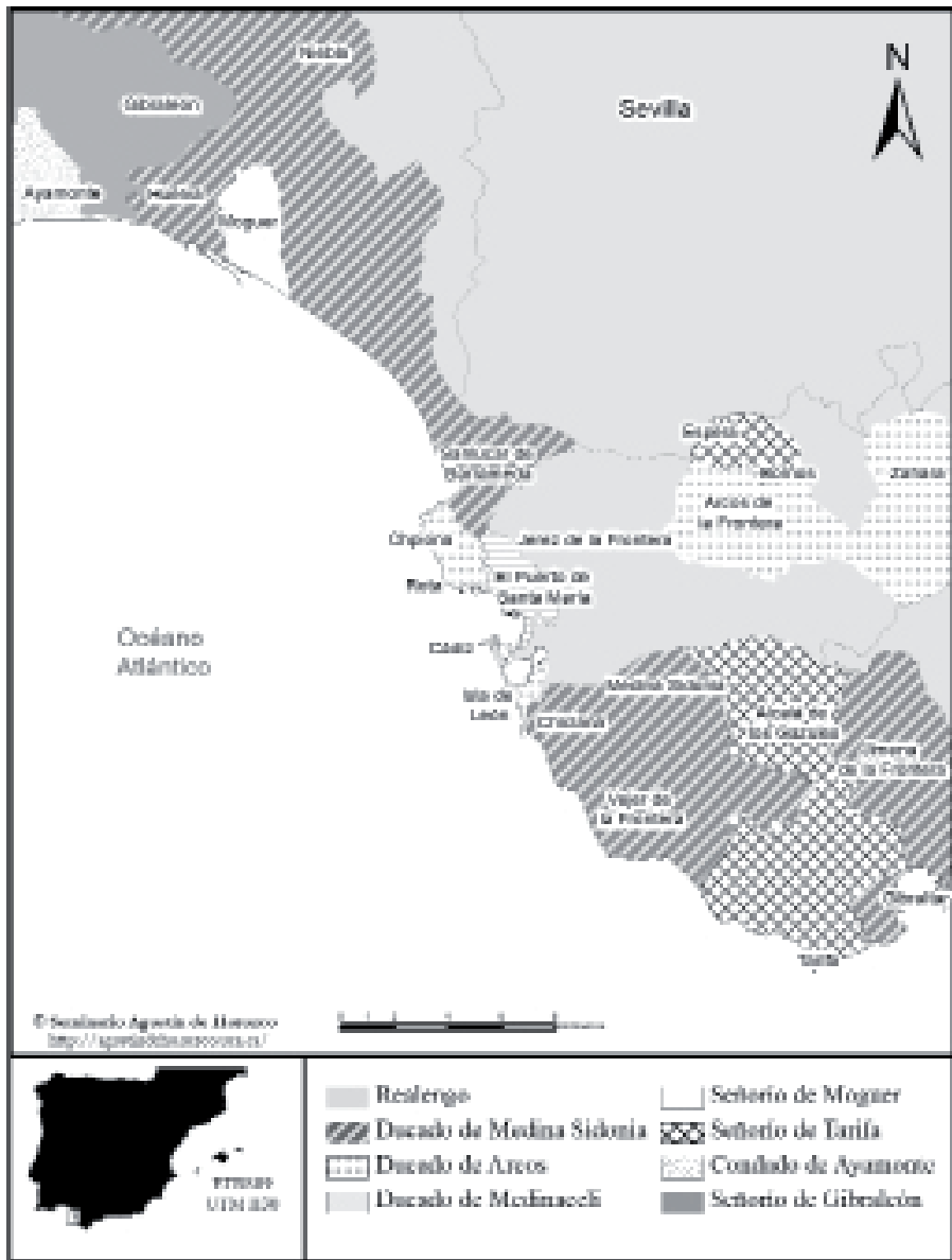
Mapa 1. Señoríos jurisdiccionales de la costa atlántica andaluza a finales de la Edad Media. Elaboración: Seminario Agustín de Horozco.