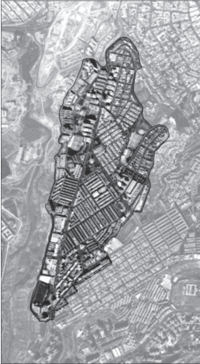
Figura 2. Área de estudio