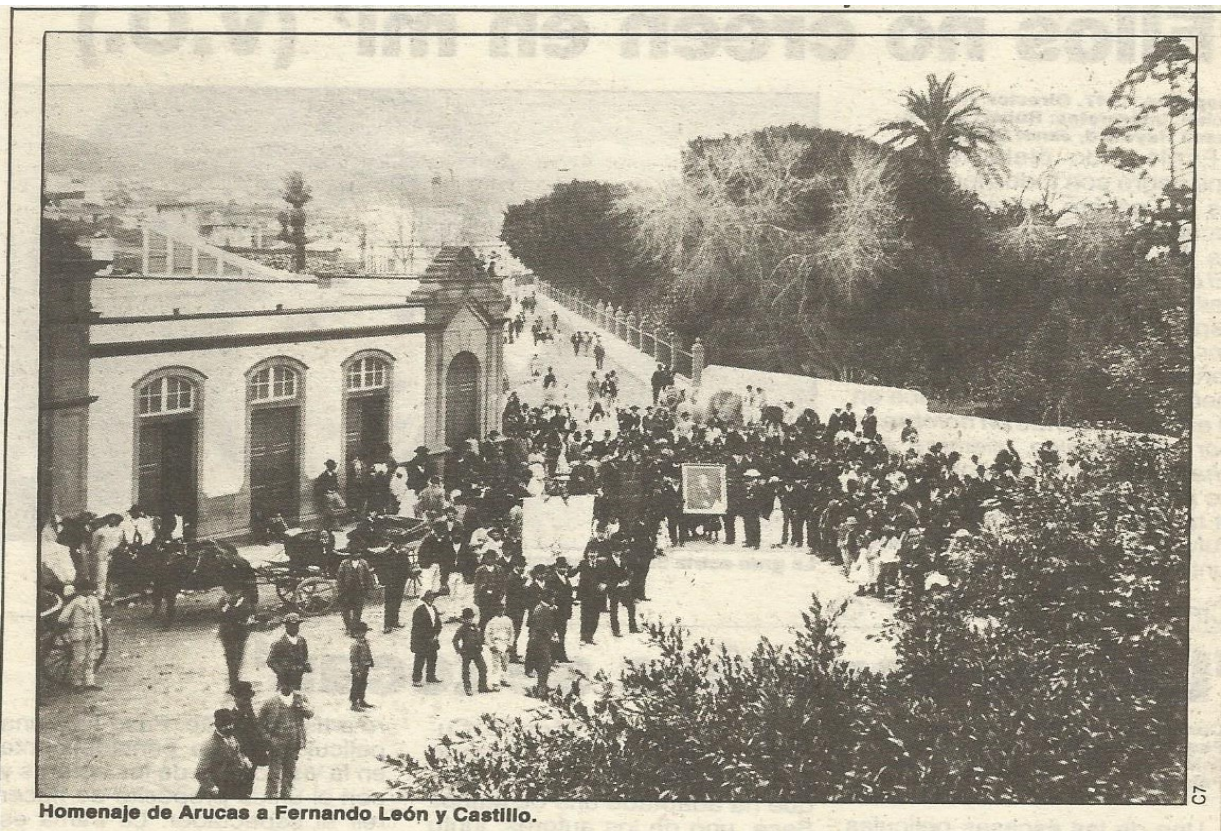
Homenaje de Arucas a Fernando León y Castillo.

Id. accidental de 92-93. Ptas. 4.838,45.-