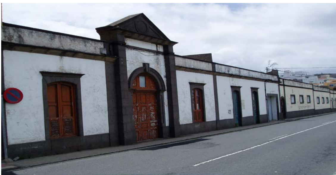
Fachada del antiguo edificio donde se instaló el Colegio de La Salle de Arucas

Colegio La Salle.- El Defensor de Arucas .-