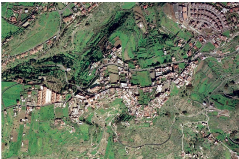
Fig. 3A: Ortofoto - La Atalaya

ciones singulares, localizaciones dominantes, relaciones funcionales y vinculación con los distintos tipos de vialidad, etc.