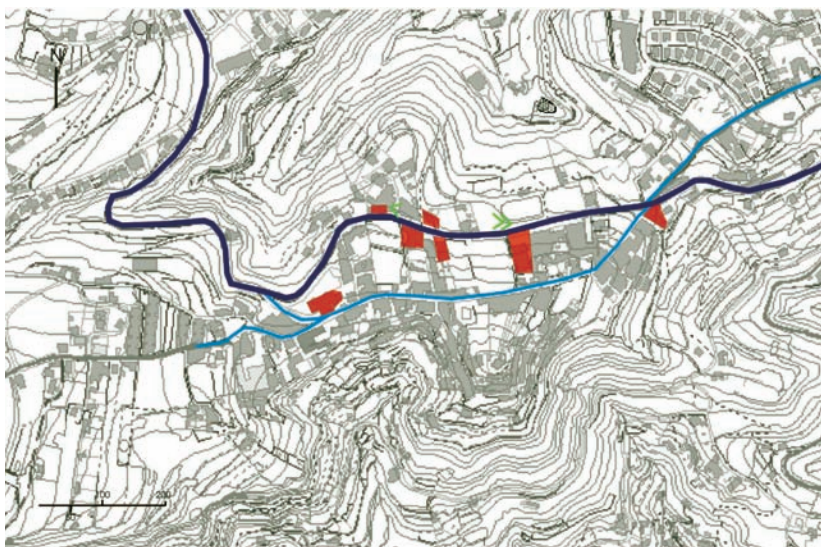
Fig. 3B: Diagrama - La Atalaya