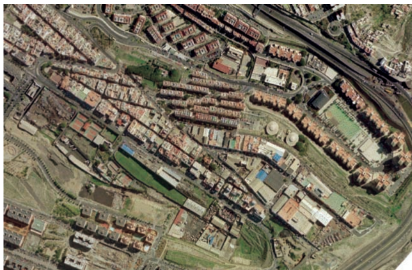
Fig. 1A: Ortofoto - Los Tarajales

A este respecto resulta crucial indagar sobre la relación entre vialidad arterial y conformación de lo urbano