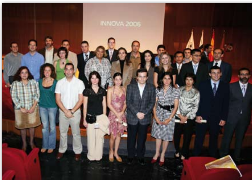
Participantes del Programa de Mecenazgo Innova

Entre 1984 y el año 2006 la FULP ha concedido un total de 893 becas y ayudas a la investigación por importe de 3.335.000 euros gracias a la confianza depositada por el centenar de patrocinadores que han formado parte del Programa Mecenazgo Innova a lo largo de sus 23 años de existencia.