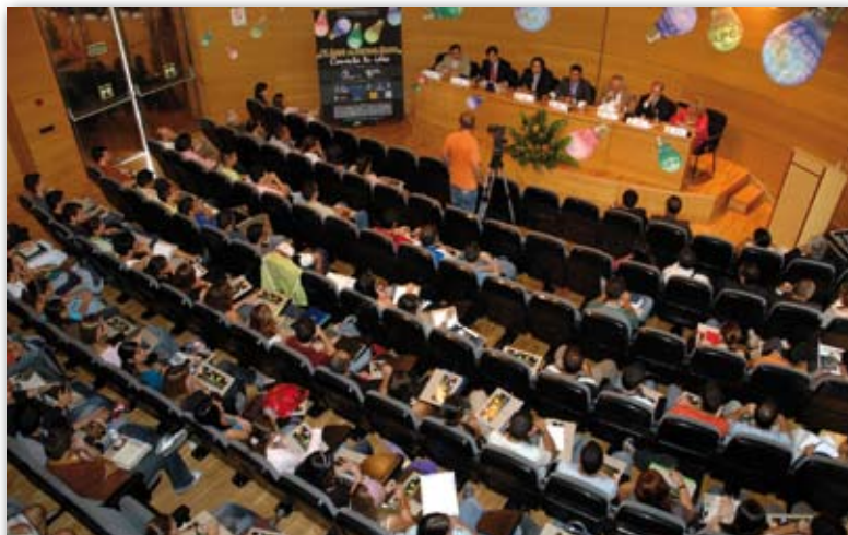
Presentación del Foro de Empleo

y dado el éxito obtenido, se decidió realizar un Foro de Empleo general para todos los centros de la ULPGC. En la tercera edición, al estar dirigida a todas las titulaciones impartidas, la Fundación Universitaria de Las Palmas se involucró plenamente en la organización del mismo. De esta forma, el año pasado tomaron parte del Foro 40 empresas y alrededor de 400 alumnos que asistieron a las jornadas técnicas y entregaron sus curriculum. Se trata de un encuentro que se va consolidando año tras año y que en futuras ediciones quiere ampliar su campo de actuación hacia el exterior, promocionando a los alumnos de la ULPGC en empresas de la Península y Europa, y dando los primeros pasos para introducirse en el mercado africano.