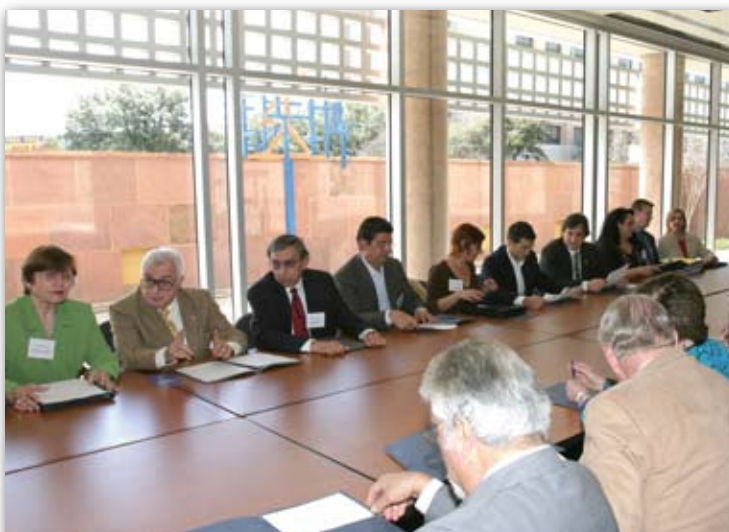
Asistentes a los actos conmemorativos en la Universidad de San Antonio de Texas

interés por continuar con los proyectos compartidos por ambas universidades y abogó por extender el actual Programa de Intercambio de Profesores en el área de Lengua Española a los campos de la Ingeniería y la Arquitectura. Asimismo, destacó la importancia de abrir