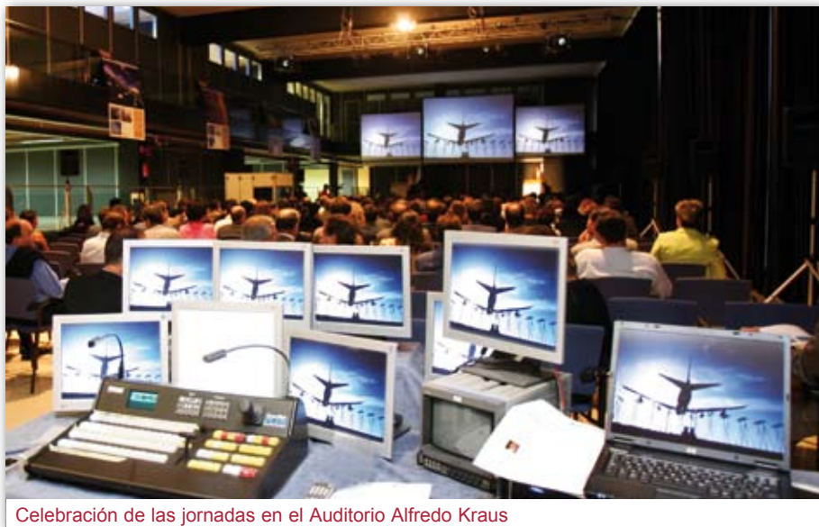
Celebración de las jornadas en el Auditorio Alfredo Kraus

seleccionadas con la ayuda de instituciones de inversión en alta tecnología de reconocido prestigio internacional, como European Venture Market y Silicon Ventures, cuyos miembros también participaron en este I Foro. Los