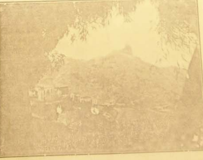
Una vista de la ciudad de Las Palmas