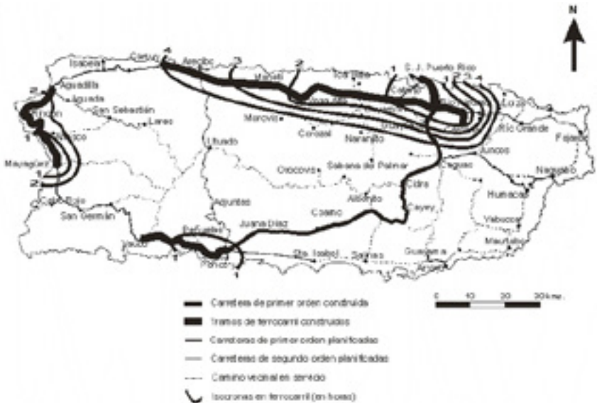
FIGURA 4 ISÓCRONAS EN FERROCARRIL DESDE SAN JUAN DE PUERTO RICO, PONCE Y MAYAGÜEZ AL RESTO DE LA ISLA EN 1893 (EN HORAS)