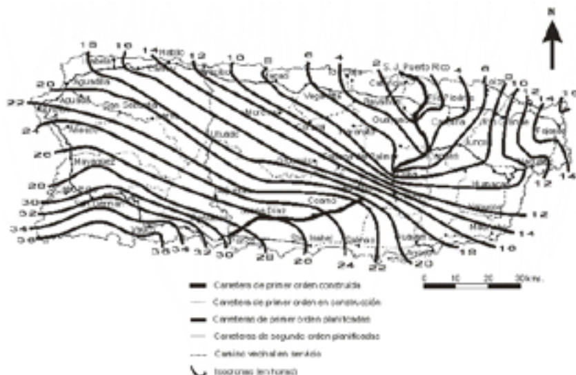
FIGURA 3 ISÓCRONAS TERRESTRES DESDE SAN JUAN DE PUERTO RICO AL RESTO DE LA ISLA EN 1880 (EN HORAS)