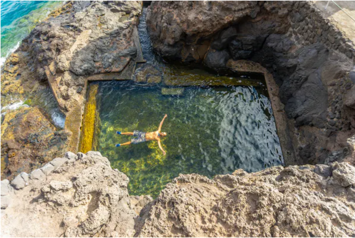
Bañista en la cala del Puerto de Puntagorda, isla de La Palma, Islas Canarias.