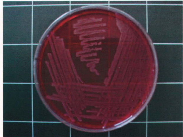
▲ Aislamiento de Salmonella spp. en Agar Verde Brillante.

dentales (La Gomera, El Hierro y La Palma) (11, 38).