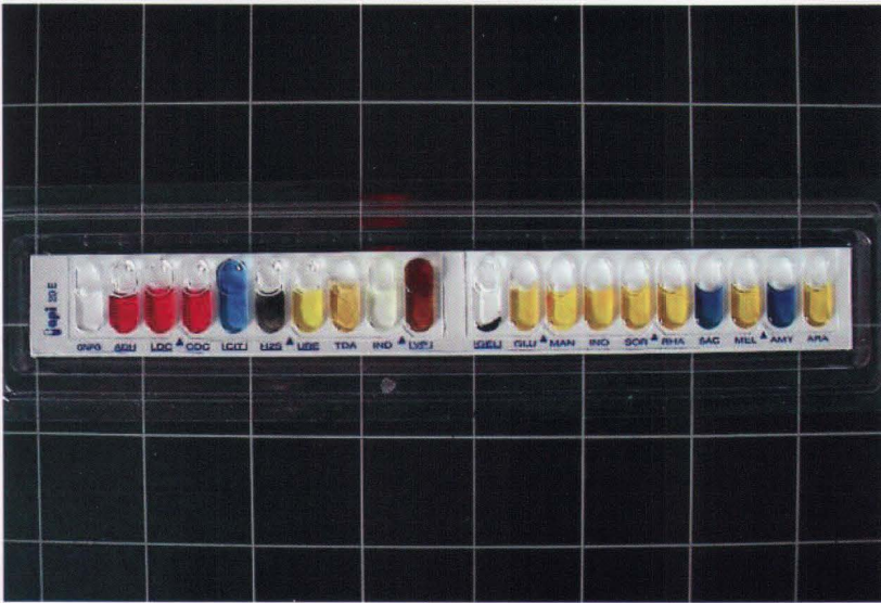
▲ API 20E de SALMONELLA SSP

tipo IV no fermenta la Melibiosa; y el biotipo V es el único que posee además el enzima b-galactosidasa. Este último biotipo, de acuerdo con sus características bioquímicas pertenece a Salmonella enterica subsp. arizonae o subsp. IIIa. Como podemos observar en la Tabla 1, el biotipo más frecuente es el biotipo IV con 30 cepas, seguido del biotipo I con 22 cepas y los biotipos III con 3 cepas y los biotipos II y V con una cepa cada uno. En las aglutinaciones con los antiseros, podemos ver en la misma Tabla que los biotipos I, II y III aglutinan con los antiseros Poly B; mientras que 28 cepas del biotipo IV aglutinan con los antiseros Poly C y dos cepas de este biotipo aglutinan con los antiseros Poly A. La única cepa perteneciente al biotipo V aglutina con los antiseros Poly D.