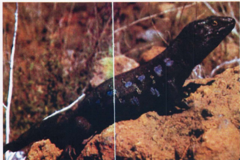
▲ Gallotia galloti .

Gallotia galloti es un lagarto endémico de la Isla de Tenerife y que ha colonizado las otras Islas Occi-