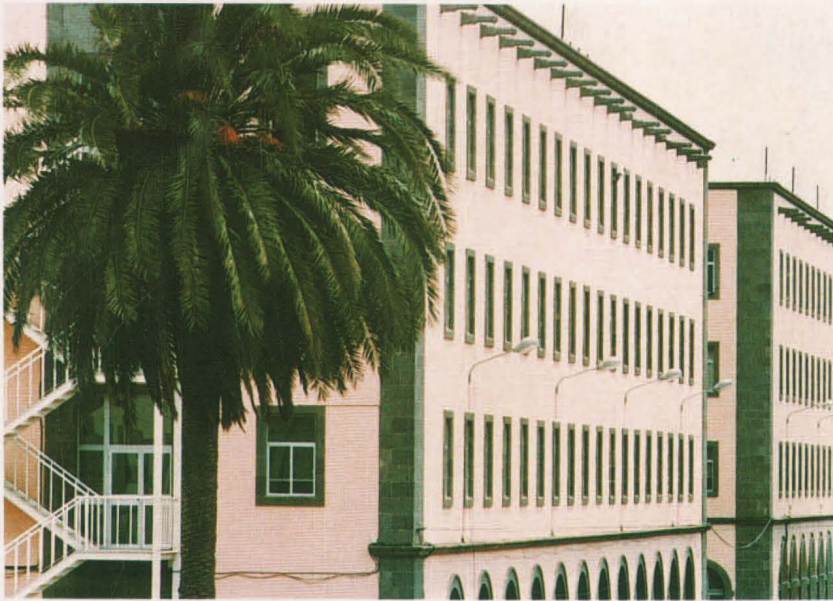
Antiguo Seminario Diocesano de Las Palmas, hoy Edificio de Electrónica y Telecomunicaciones.

En este curso académico 94-95 se concluye también la ampliación de los Edificios de Humanidades e Ingenierías, y se inicia la reforma de los Pabellones A y B del antiguo Seminario, en los que se ubican los estudios de Telecomunicaciones, con lo que se adaptará su interior a las exigencias tecnológicas avanzadas, respetando el exterior que diseñara el famoso arquitecto Zuazo.