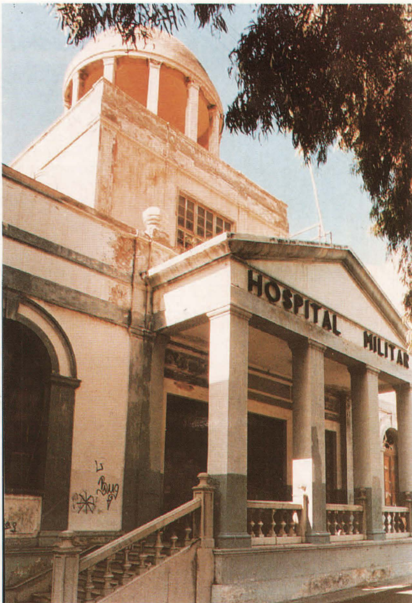
Antiguo Instituto de Enseñanza Medio de Las Palmas, luego Hospital Militar y ahora futura sede institucional de la Universidad.

El cuadro de inversiones en el Campus de Tafira se completa con la urbanización interior del Campus, ajardinamiento y adecuación de los aparcamientos.