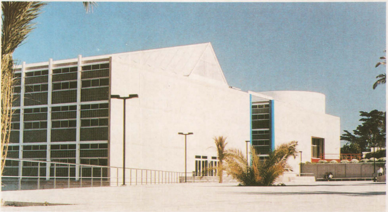
Campus de Tafira.

cesión del edificio a la Universidad de las Palmas de Gran Canaria, una vez autorizados fondos europeos para su restauración y destino educativo. El edificio ocupa aproximadamente una superficie construida de 2.340 metros cuadrados, con un jardín de unos 2.900 metros cuadrados. Posee un alto valor arquitectónico, con alzado clasicista académico y con el único templete que hay en la ciudad.