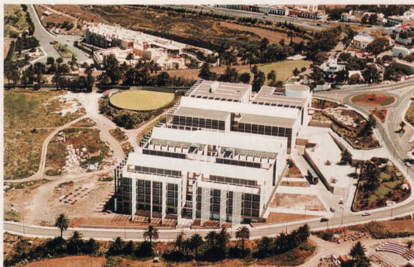
Vista aérea del Campus de Tafira.

El Plan de Inversiones, recientemente aprobado, prevé un total de 11.918 millones para culminar las obras de la institución universitaria