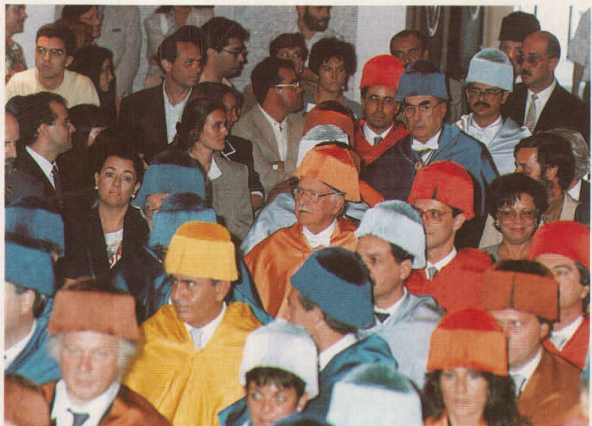
Entrada de la comitiva académica al Acto.

La Memoria del Curso Académico 1993/94 recoge los principales acuerdos de los órganos de gobierno de la Universidad de Las Palmas de Gran