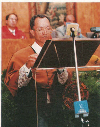
El Doctor Roque Calero Pérez, Catedrático de Ingeniería Mecánica, ofreció la lección inaugural sobre «Evolución Tecnológica e Impacto Social».

El número de alumnos matriculados en el curso 1993/94 ascendió a 20.135, lo que supone un 5% de aumento con respecto al curso anterior. Asimismo, se matricularon 1.118 alumnos de postgrado.