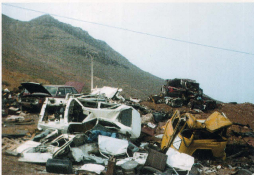
En Gran Canaria hay numerosos puntos con vertederos incontrolados, escombreras y chatarra abandonada, como la que muestra la fotografía. Todos ellos generan un impacto paisajístico muy importante.

Se han originado pues, nuevos procesos de ocupación y usos del suelo que han configurado un nuevo modelo espacial. Este nuevo modelo territorial ha sido estructurado en función de aquellos agentes sociales propietarios de los medios de producción, propietarios del suelo, del agua, de las materias primas, promotores inmobiliarios, agentes de la construcción, organismos públicos, etc. Agentes que se han convertido en estrategias de la construcción espacial en busca siempre de la