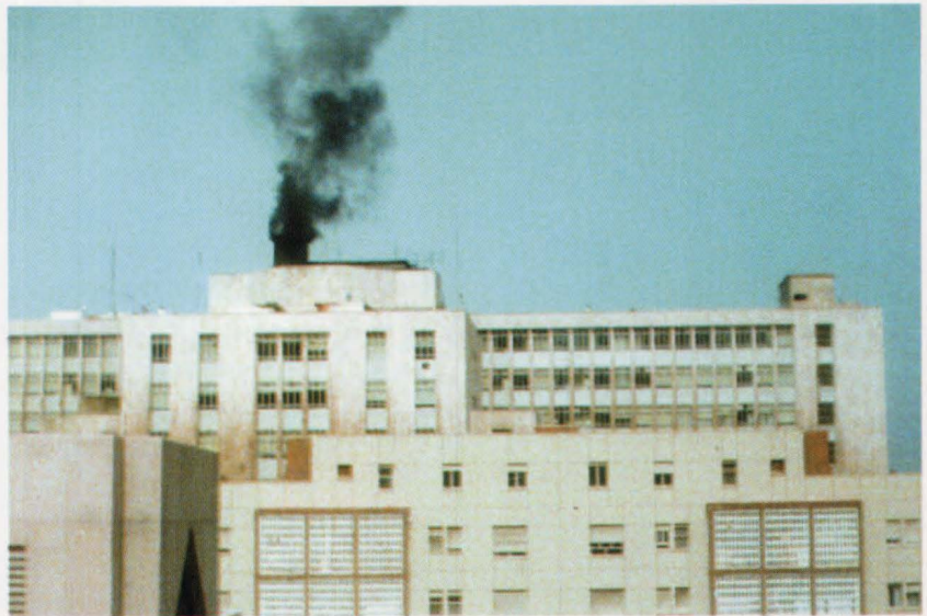
Horno incinerador de la Clínica del Pino. Las escorias y cenizas procedentes de la incineración de residuos sanitarios altamente tóxicos y peligrosos, son gestionados como las basuras domésticas y van a parar a los vertederos de Residuos Sólidos Urbanos sin haber recibido un tratamiento previo.

Sin embargo, existen otros modelos y sistemas de gestión que dan prioridad a las opciones sostenibles a largo plazo, considerando los vertederos controlados como una solución inmediata pero no única ni definitiva.