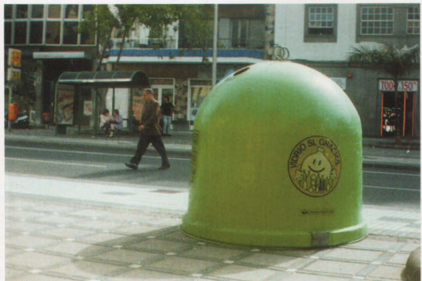
Prácticamente el único material que se está reciclando con éxito en Gran Canaria es el vidrio.

Otra necesidad apremiante para nuestra isla es el establecimiento de una «ecotasa», con la cual se responsabilice de la adecuada gestión de los residuos identificables (residuos que al no perder las características aparentes del producto de origen permiten su identificación) a los fabricantes e importadores de los productos de los que se derivan. La cantidad recaudada podría servir para establecer parte de