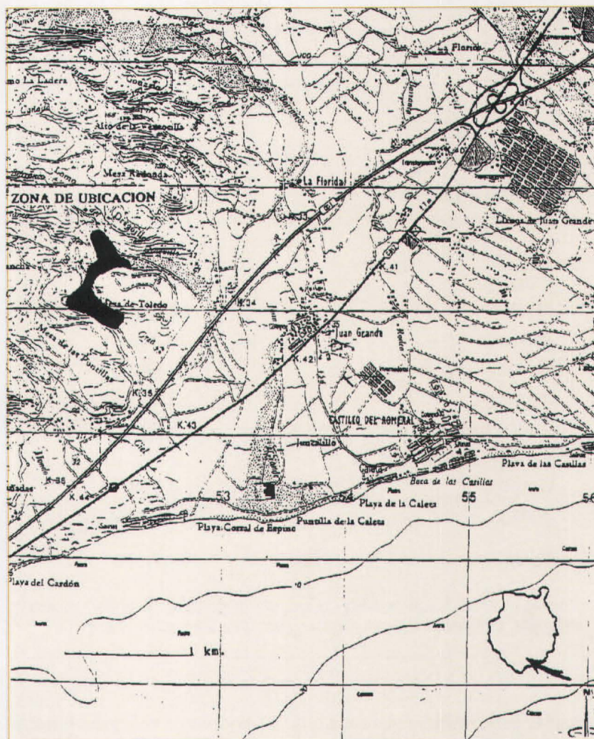
Zona de ubicación de la planta de compostaje y vertedero de Juan Grande (Gran Canaria).

No debemos olvidar que sólo en los Vertederos del Salto del Negro y Juan Grande, se realiza compactación y cubrición diaria de las basuras. No así en Amagro.