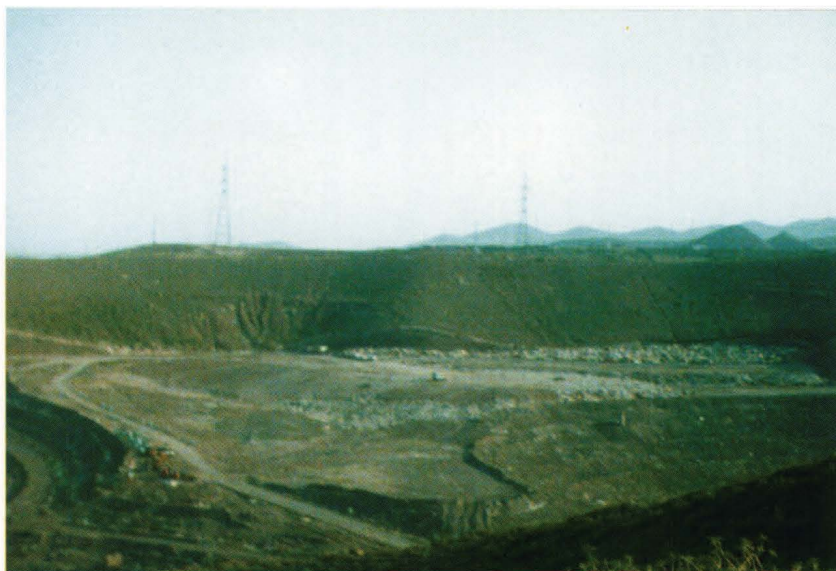
Vertedero del Salto del Negro a punto de colmatarse.