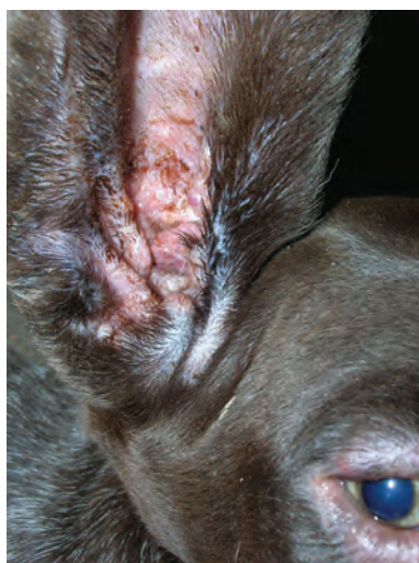
▲ Figura 3. Cara interna de pabellones auriculares eritematosos, costrosos y exudado amarillento.

Aunque su curso y evolución son bastante rápidos, tras el diagnóstico, la respuesta al tratamiento es muy eficaz. La terapia debe realizarse cuanto antes y de modo agresivo para resolver los efectos sistémicos de la enfermedad y evitar las cicatrices cutáneas (1,3,4,5). La respuesta a los antibióticos como único tratamiento es ineficaz, pero