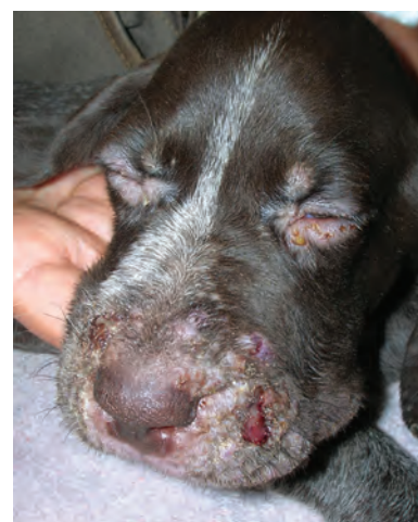
▲ Figura 1. Cachorro de Braco de 8 semanas con cuadro dermatológico y aspecto general muy decaído.